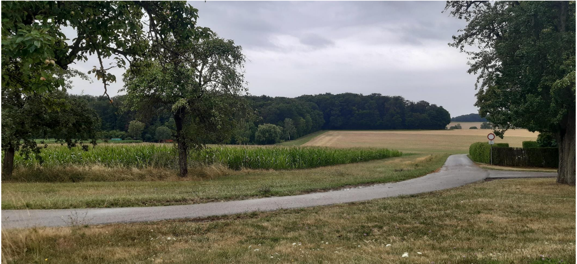
Abbildung 2: Blick von der Kreisstraße im Norden (Standpunkt 1), BIT Stadt + Umwelt