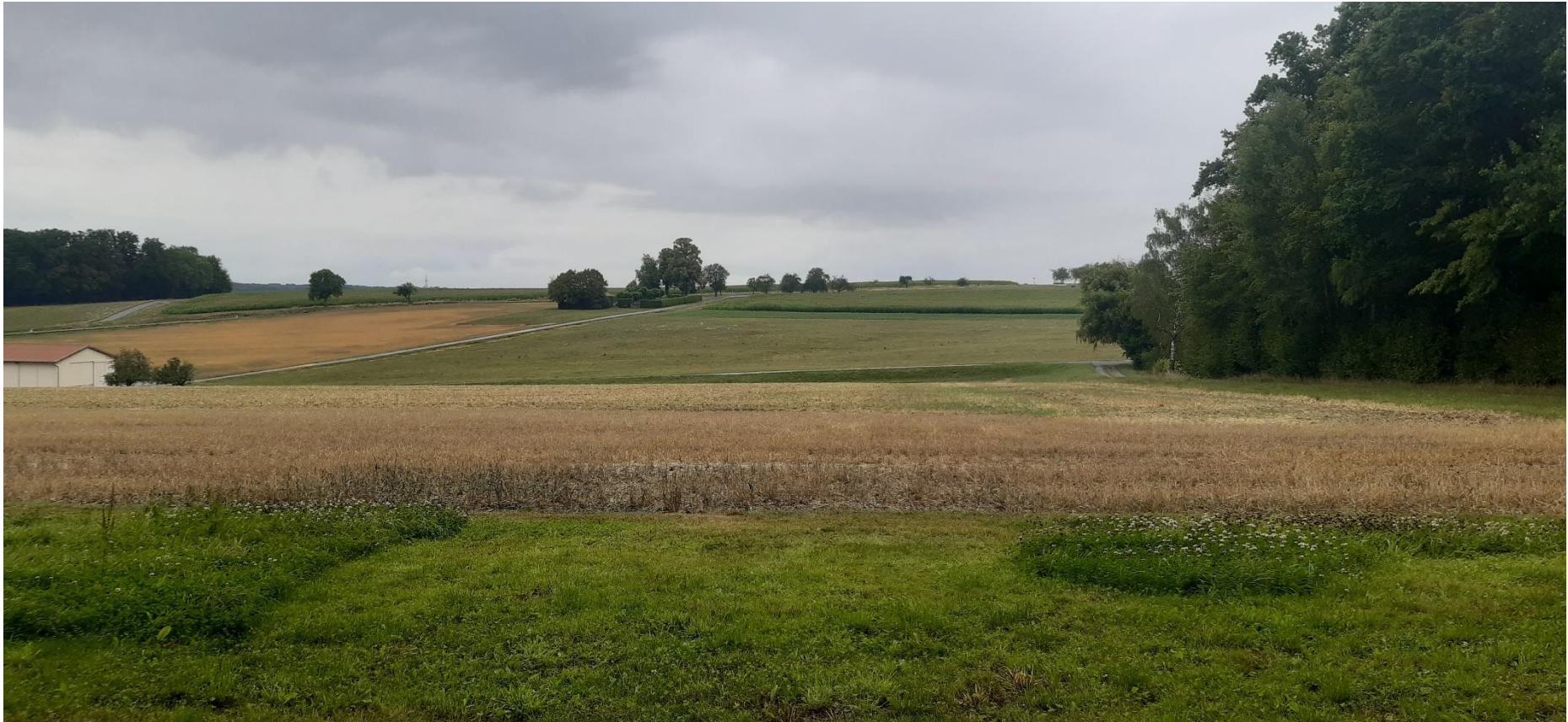
Abbildung 6: Blick von Süden (Standpunkt 5), BIT Stadt + Umwelt