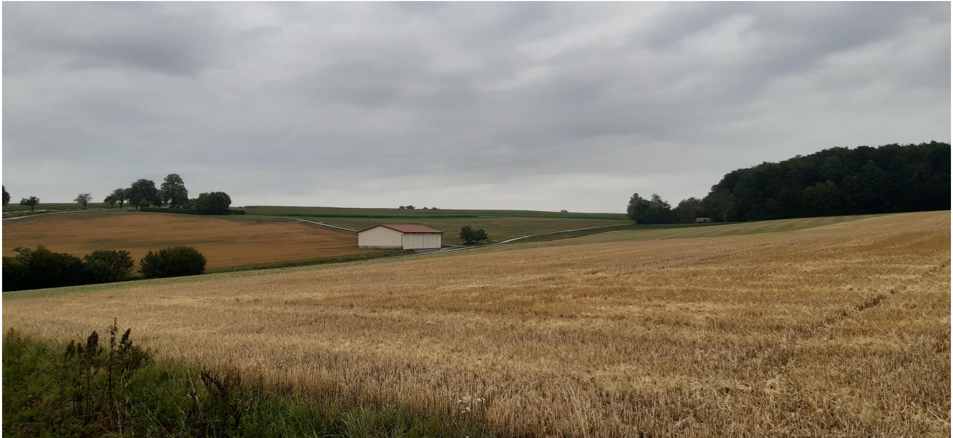
Abbildung 4: Blick von Südwesten (Standpunkt 3), BIT Stadt + Umwelt