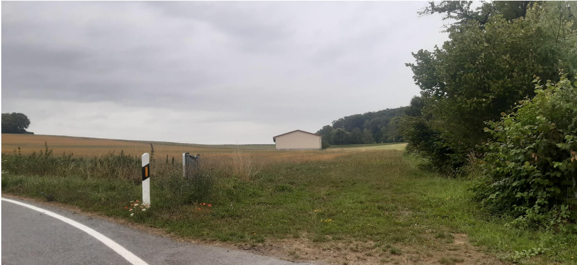
Abbildung 3: Blick von Kreisstraße (Standpunkt 2), BIT Stadt + Umwelt