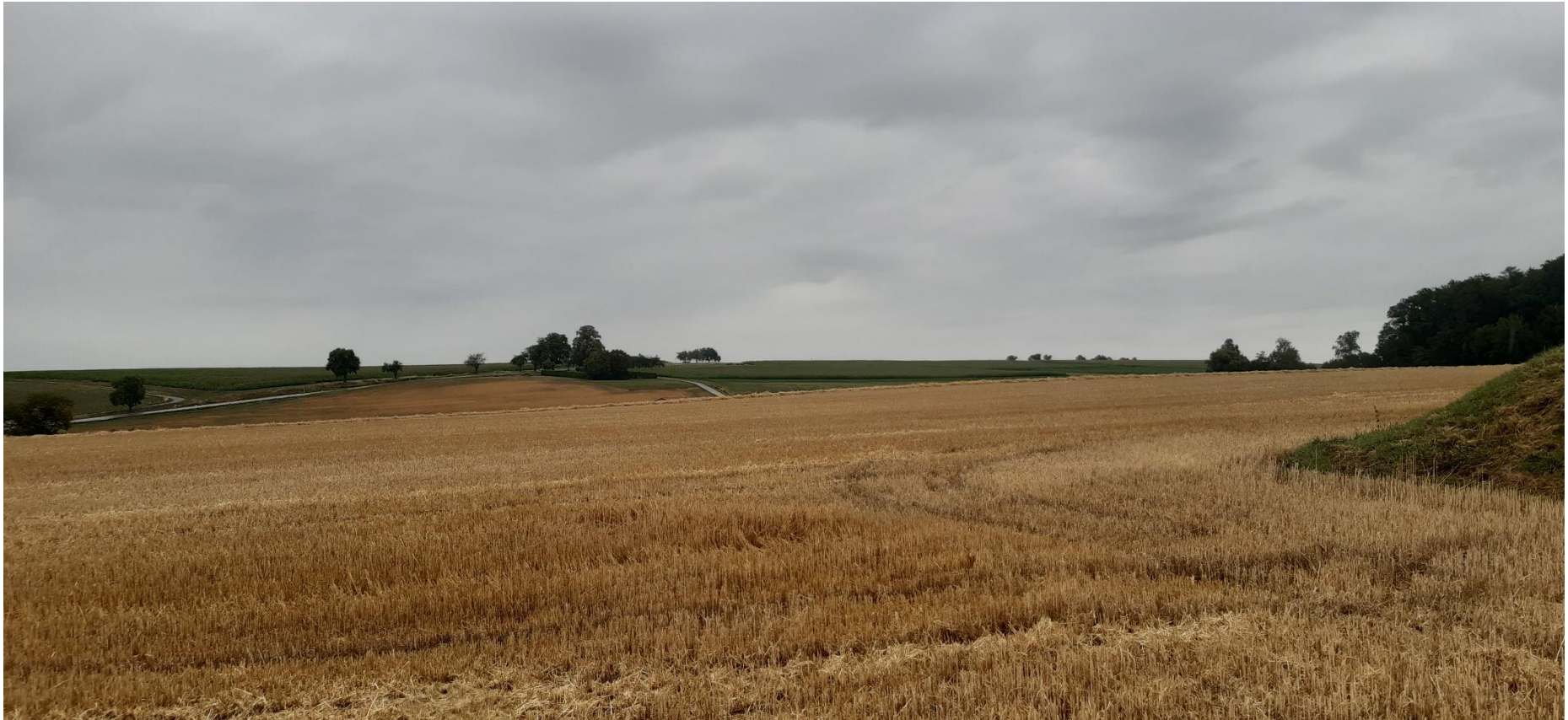
Abbildung 5: Blick von Südwesten (Standpunkt 4), BIT Stadt + Umwelt